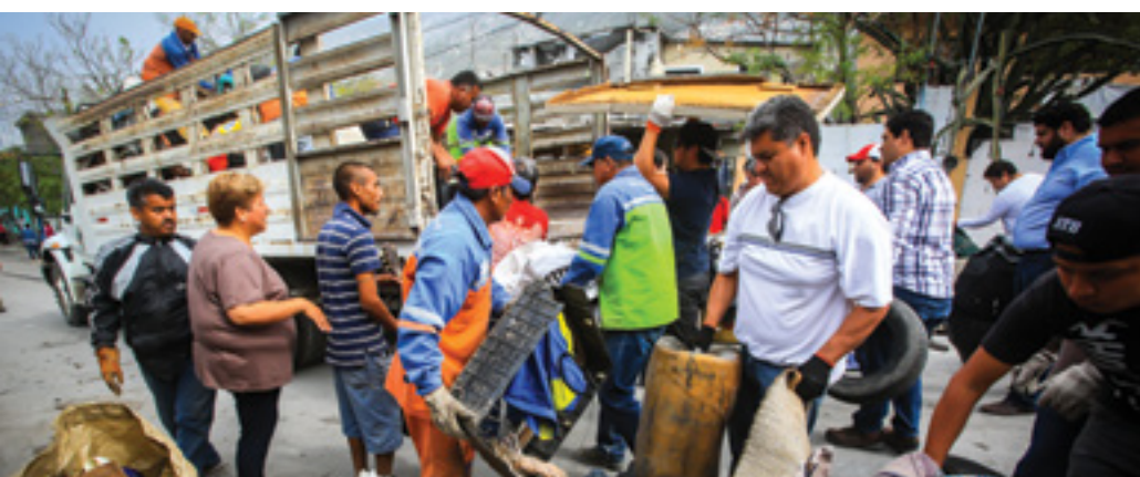
Jornada de Descacharrización

Con el fin de atender el problema generado por el acumulamiento de llantas en desuso y los riesgos para la salud pública que representa su concentración, se celebró un Convenio para el Tratamiento de Neumáticos con la empresa Cementos Mexicanos (CEMEX), el cual tiene por objeto establecer estrategias y mecanismos de colaboración para garantizar el adecuado manejo de los residuos generados por los neumáticos utilizados en el municipio. A la fecha de este informe, se han entregado aproximadamente 8 mil llantas a Cementos Mexicanos para su procesamiento, representando 84 toneladas de peso.