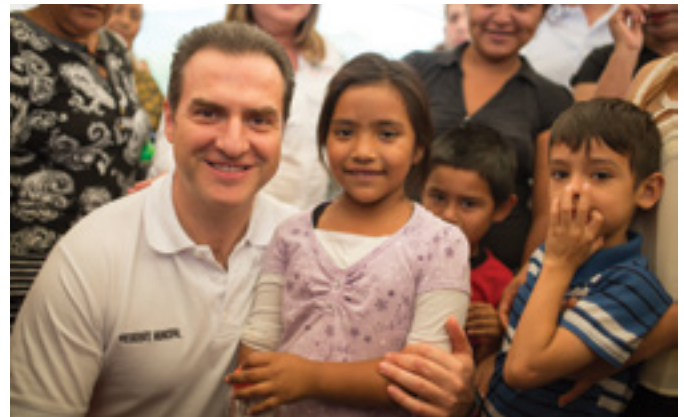
Junta de Vecinos