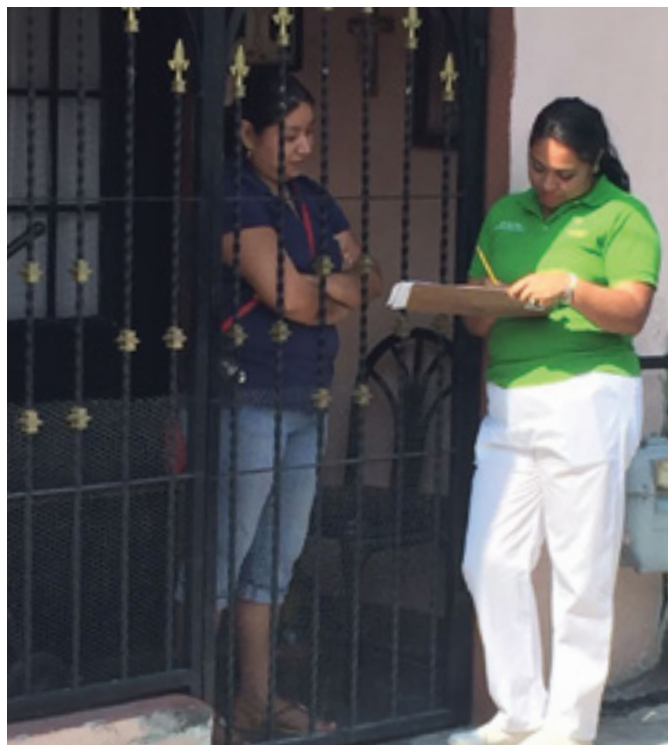
Programa Médico de Barrio

En lo referente a la prevención de enfermedades, se ha implementado el Censo de Salud Municipal, que a la fecha ha registrado a más de 17 mil personas; así mismo se han realizado campañas de salud permanentes, entre las que destacan las relacionadas al combate contra la influenza, dengue, chikungunya y zika. Adicionalmente, se implementaron campañas para la donación de sangre, nutrición, cirugía de cataratas, electrocardiografía, prevención del cáncer cérvico uterino y de mama, en beneficio de 77 mil 643 personas.