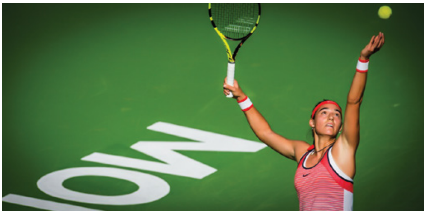
Abierto Monterrey de Tenis