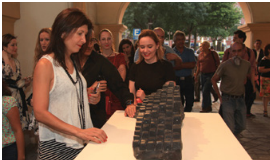
Exposición en el Museo Metropolitano de Monterrey

Así también, cumpliendo con el compromiso de acercar el séptimo arte a todos los rincones del municipio de forma gratuita, se han realizado 152 funciones del programa Cine en tu Colonia, en el cual se fomenta la convivencia vecinal, la unión familiar y el sano esparcimiento, beneficiándose a más de 10 mil personas.