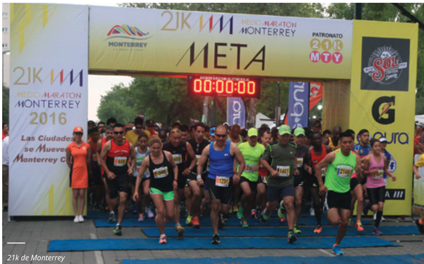
21k de Monterrey

La carrera 21K de Monterrey es un maratón se llevó a cabo en el mes de abril, en el cual compitieron 3 mil 200 corredores. Además, con el fin de incentivar el deporte, en este primer año de gobierno se ha realizado la gestión de recursos federales por un total 24.9 millones pesos para la construcción de 2 pistas de atletismo de primer nivel.