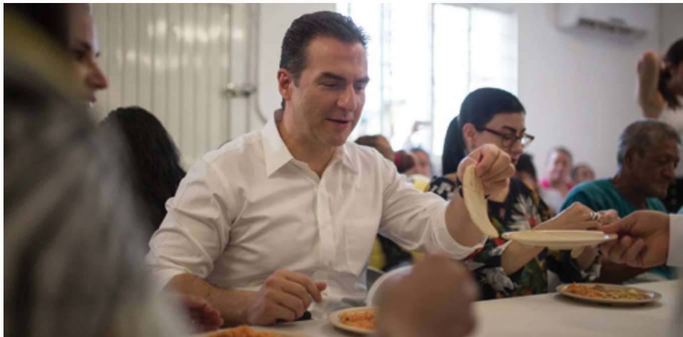
Comedor Comunitario La Gran Ciudad

En conjunto con la Secretaría de Desarrollo Social (SEDESOL) federal, el Gobierno Municipal puso en marcha el primer Comedor Comunitario de La Gran Ciudad en la Colonia Tierra y Libertad. El comedor ofrece 7 mil raciones de alimentos mensuales a habitantes de este sector. Próximamente, con una inversión de 4 millones de pesos, se pondrán en servicio dos comedores más en el sector San Bernabé y en la zona Altamira-Campana.