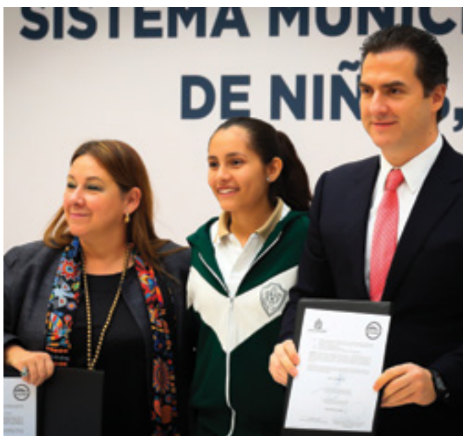
Sistema Municipal de Protección Integral de niñas, niños y adolescentes de Monterrey

En esta misma línea, el municipio de Monterrey fue investido con la Vocalía de Capacitación y Difusión de la Red Mexicana de Ciudades Amigas de la Infancia y Adolescencia, para el periodo 2016-2017. Esta Red, es una iniciativa global del Fondo de las Naciones Unidas para la Infancia (UNICEF), que promueve el desarrollo e incremento de programas municipales para la protección de la infancia y adolescencia; lo que enfatiza y demuestra el liderazgo y sensible compromiso del gobierno municipal en esta materia.