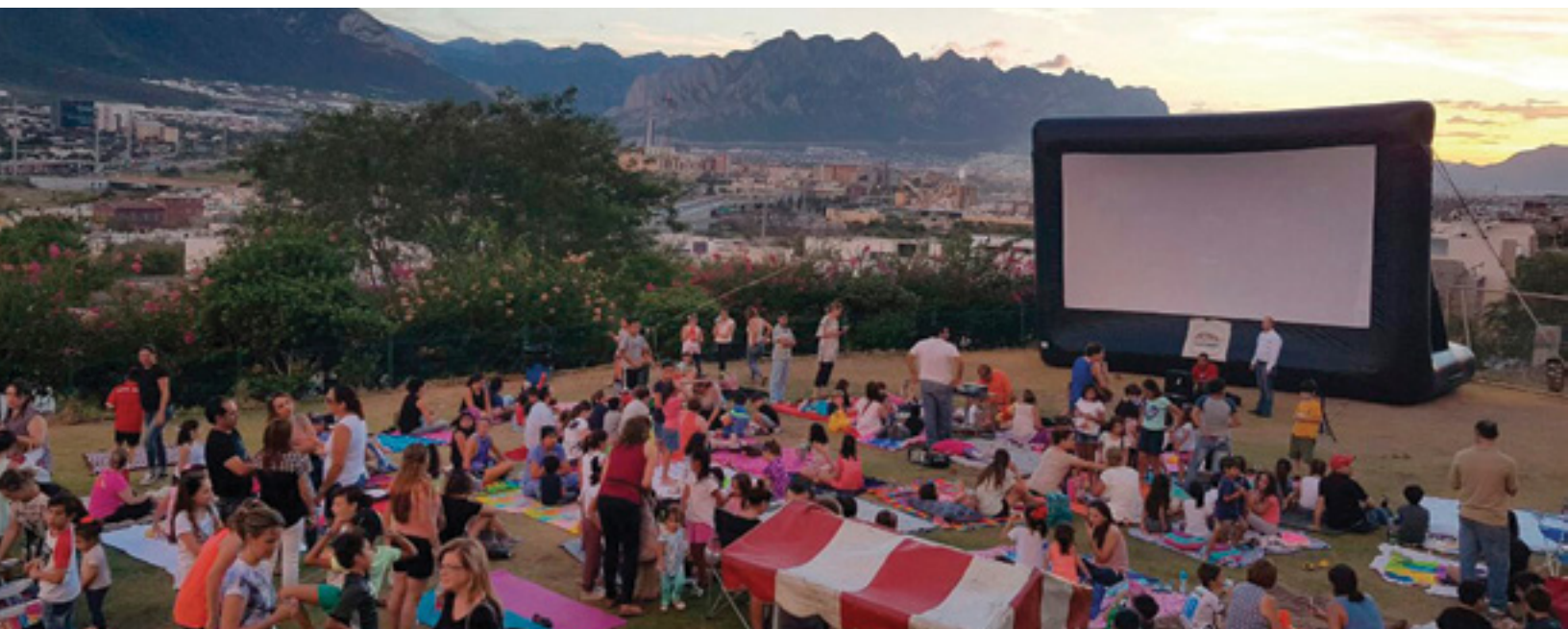
Cine en tu Colonia

Así también, cumpliendo con el compromiso de acercar el séptimo arte a todos los rincones del municipio de forma gratuita, se han realizado 152 funciones del programa Cine en tu Colonia, en el cual se fomenta la convivencia vecinal, la unión familiar y el sano esparcimiento, beneficiándose a más de 10 mil personas.