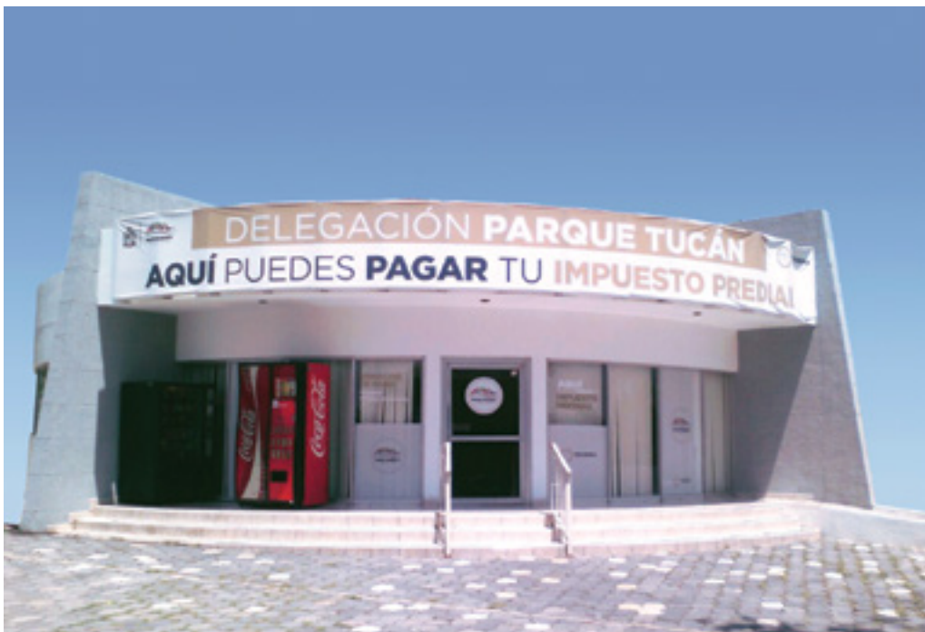
Centros de Atención Municipal (CAM)