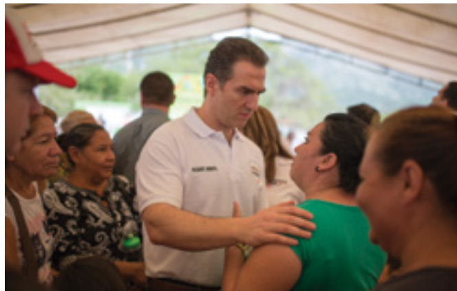
Juntas vecinales en materia de seguridad

Una de las estrategias para escuchar, atender y resolver las solicitudes ciudadanas en materia de seguridad es el programa Juntas Vecinales, el cual tiene como objetivo disminuir la incidencia delictiva en las tres zonas de la ciudad que están bajo la responsabilidad de la Secretaría de Seguridad Pública y Vialidad del municipio de Monterrey, es decir, las zonas centro, oriente y poniente de la ciudad. En este primer año se han realizado diversas reuniones de este programa, teniendo un aforo total de 866 vecinos que se encuentran colaborando paralelamente como Vecinos Vigilantes; con ello, se da cumplimiento a un compromiso realizado con los ciudadanos de Monterrey.