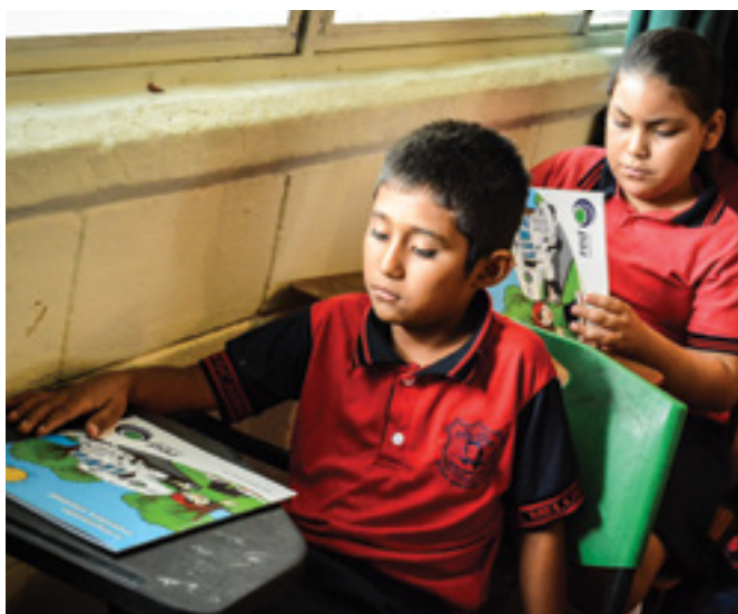
Programa Detectives Ambientales