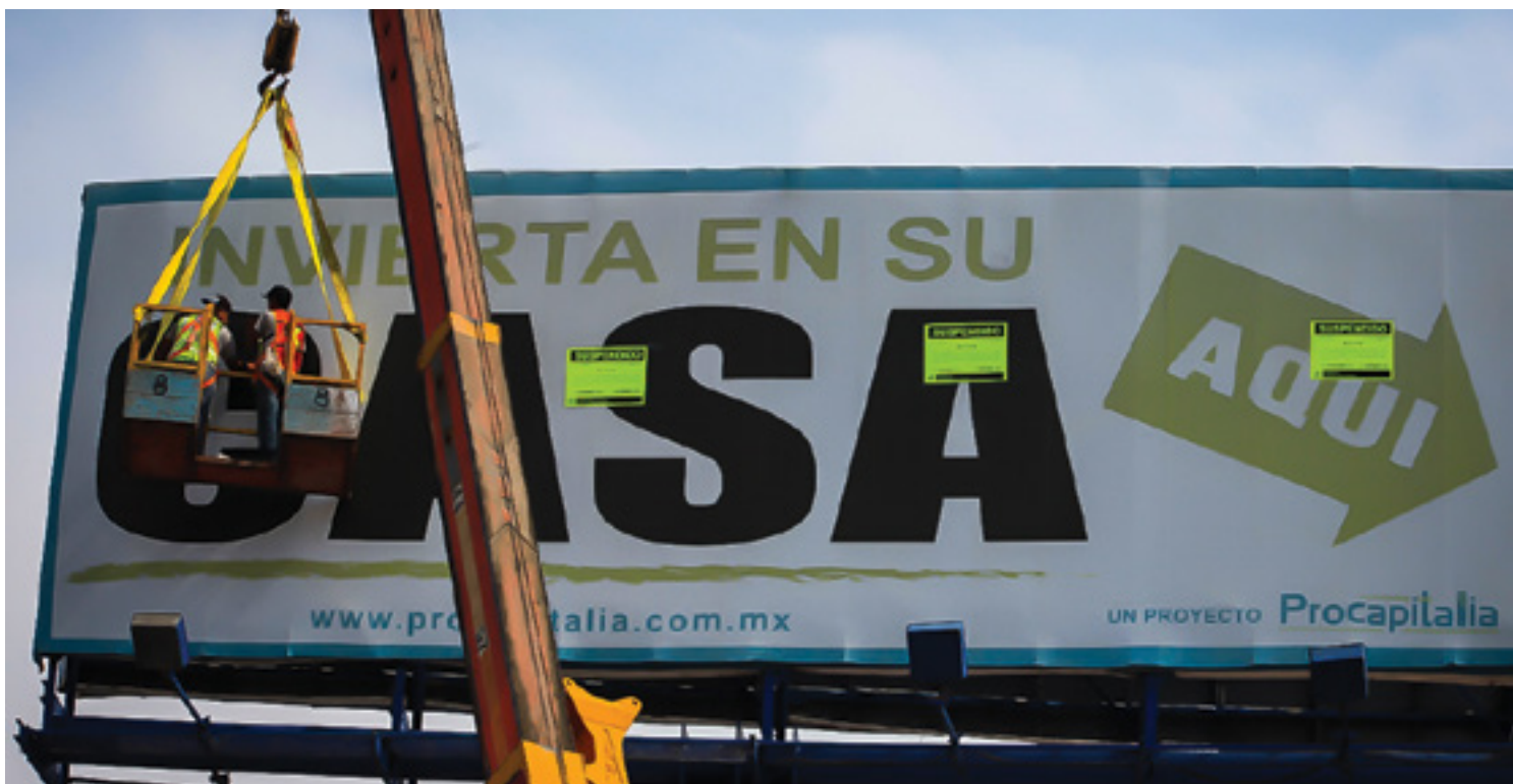
Operativo de regulación de anuncios panorámicos

tecnologías en publicidad visual. Como parte de este programa se han realizando operativos diarios para el retiro continuo de pendones y anuncios en postes; también se llevaron a cabo operativos de regulación de formatos de gran escala, en el que se han suspendido 200 anuncios publicitarios entre panorámicos, puentes peatonales, muppies, etcétera, que presentaban diversas irregularidades.