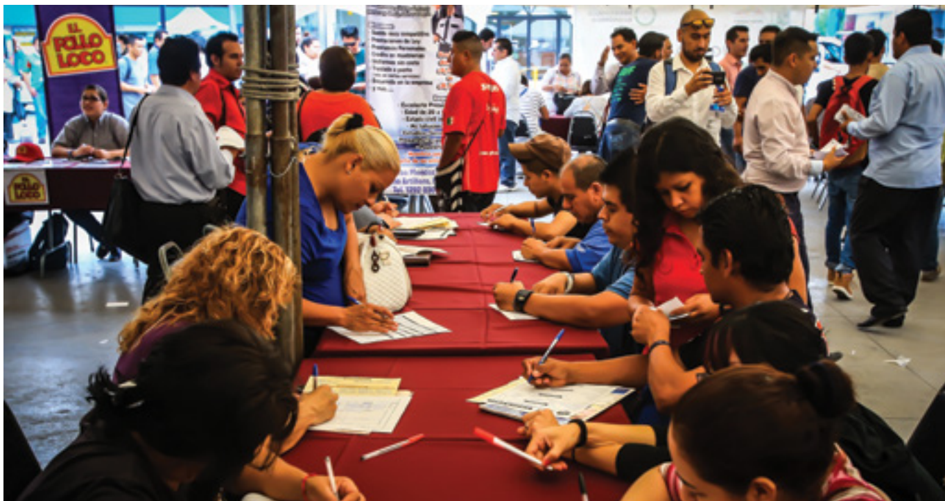
Brigada de empleo