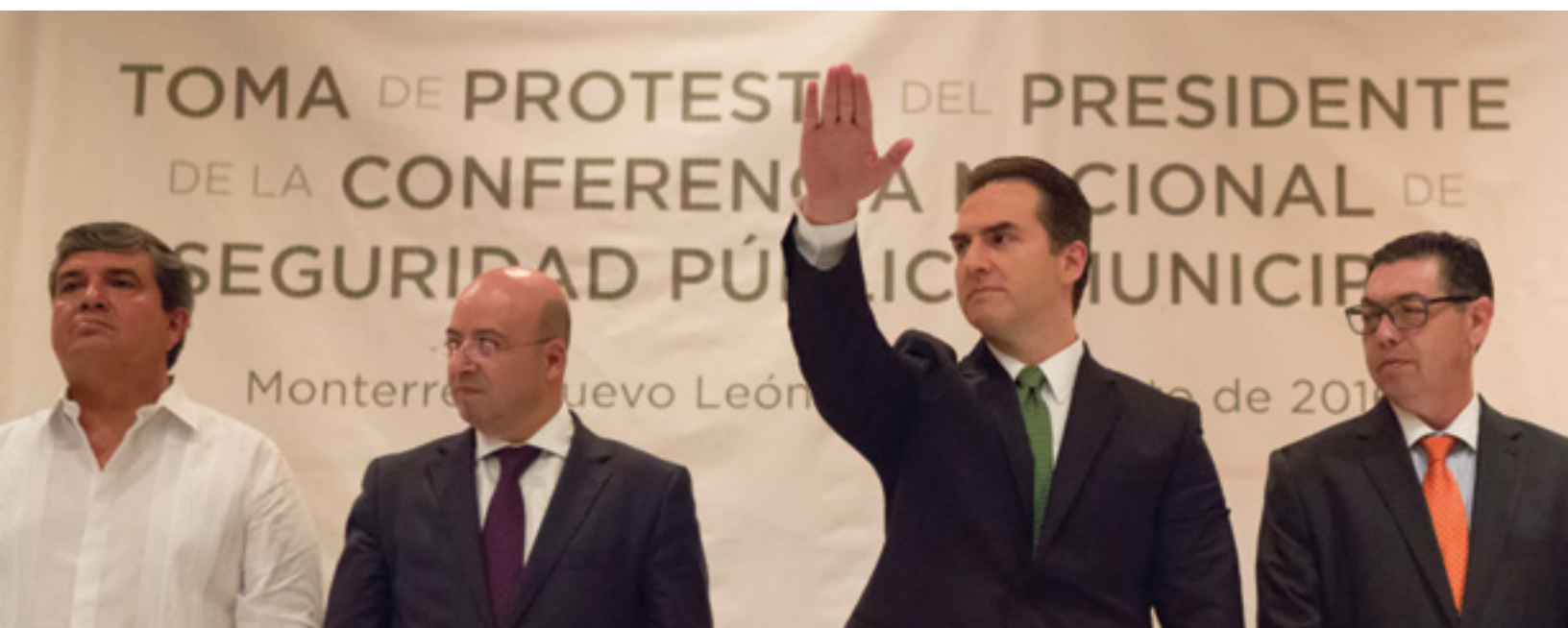
Conferencia Nacional de Seguridad Pública Municipal en la que el Alcalde fue nombrado Presidente

Respecto al tema de prevención en jóvenes, el Centro para la Prevención de la Violencia y la Delincuencia Juvenil (PREVIDEJ); implementó los programas de Prevención y Atención en el tema de Conductas Delictivas y Violentas en Jóvenes, y Jóvenes en Riesgo. A través de campañas de difusión, se brindó información importante para prevenir conductas delictivas. Con estos programas se ha beneficiado a un total de 11 mil 701 ciudadanos regios.