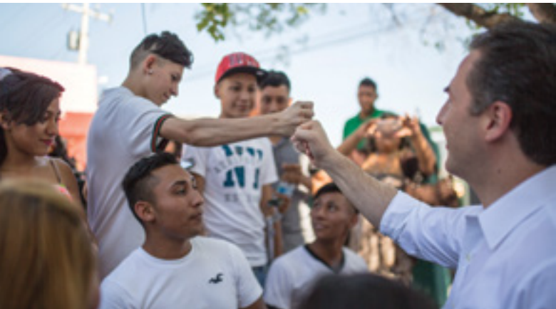
Programa identidad urbana