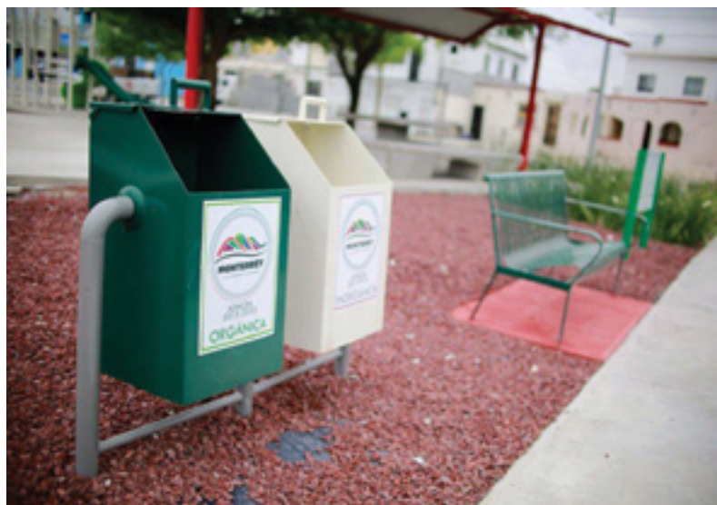
Mejoramiento de plazas

Con el fin de atender el problema generado por el acumulamiento de llantas en desuso y los riesgos para la salud pública que representa su concentración, se celebró un Convenio para el Tratamiento de Neumáticos con la empresa Cementos Mexicanos (CEMEX), el cual tiene por objeto establecer estrategias y mecanismos de colaboración para garantizar el adecuado manejo de los residuos generados por los neumáticos utilizados en el municipio. A la fecha de este informe, se han entregado aproximadamente 8 mil llantas a Cementos Mexicanos para su procesamiento, representando 84 toneladas de peso.