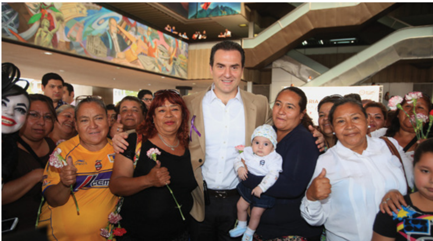
Programa Feria Integral de la Mujer

A través del programa Lazos entre Mujeres, se han realizado 539 talleres y 11 juntas mensuales de una red integrada por damas, en el que se han impartido cursos de temas relativos al empoderamiento de la mujer, además de ofrecer actividades como círculos de lectura, conferencias, pláticas motivacionales, talleres de prevención de la violencia, talleres productivos, beneficiando a más de 7 mil mujeres en lo que va de la administración.