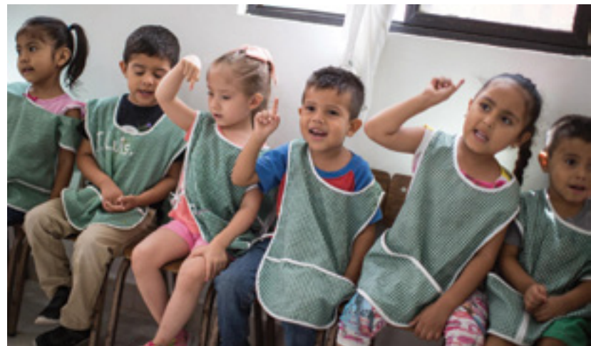
Niños en estancia Infantil

Así mismo, con la finalidad de apoyar a los padres de familia que trabajan y requieren un servicio de cuidado y atención infantil que les permita conciliar su vida laboral y familiar, se han beneficiado a 299 niñas y niños de 1 a 12 años de edad en promedio mensual, a través de siete Estancias Infantiles y dos Centros de Desarrollo Infantil, en donde los infantes recibieron atención médica, cuidados, educación, recreación, así como una sana alimentación, sirviendo a la fecha, un total de 109 mil 151 raciones de comida. Cabe mencionar que la actual administración rehabilitará próximamente las siete Estancias Infantiles y uno de los Centro de Desarrollo Infantil, con una inversión total de 7.3 millones de pesos.